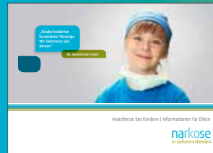
Anästhesie bei Kindern